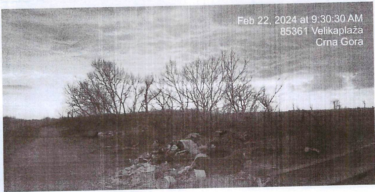
Feb 22, 2024 at 9:30:30 AM 85361 Velikoplaza Crna Gora