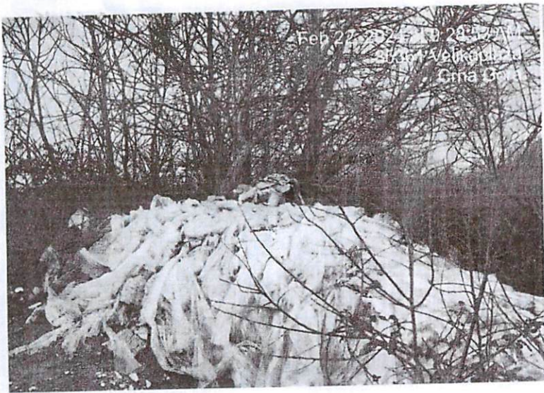
Feb 22, 2024 at 9:31:28 AM 85361 Velikoplaza Crna Gora