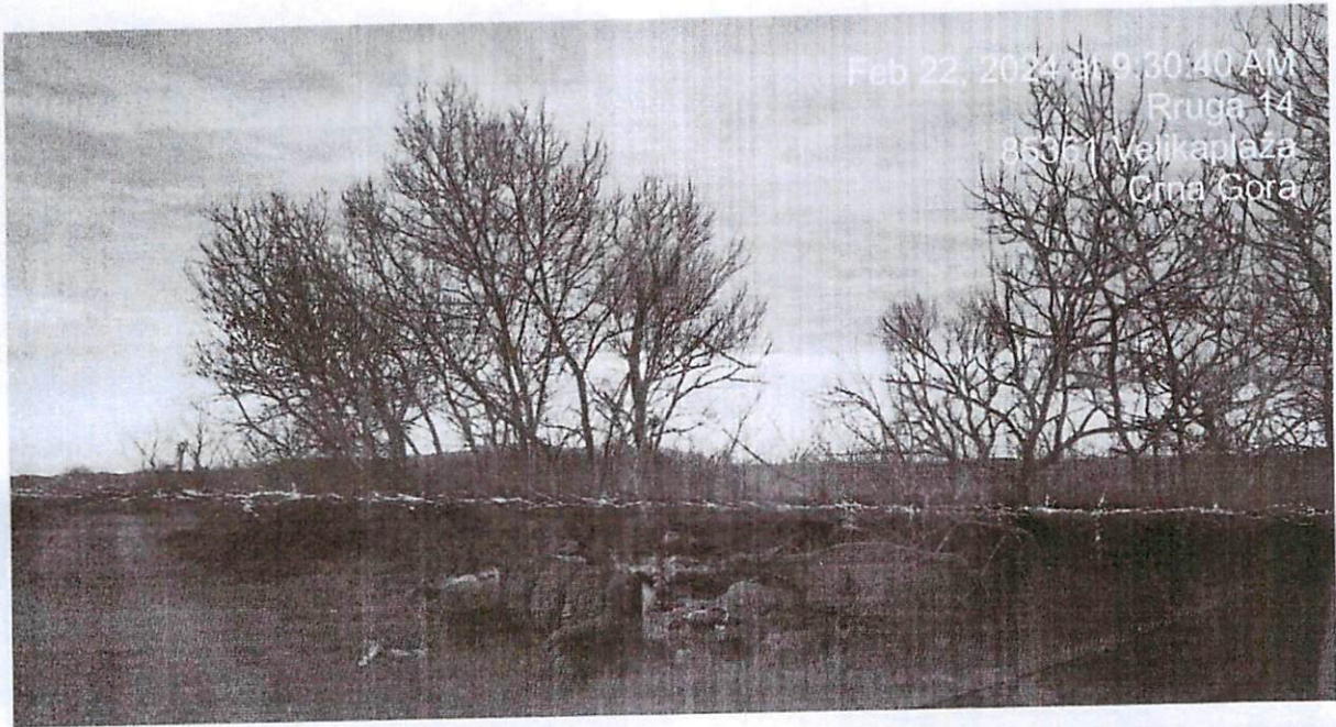
Feb 22, 2024 at 9:30:40 AM Rruga 14 85361 Velikoplaza Crna Gora